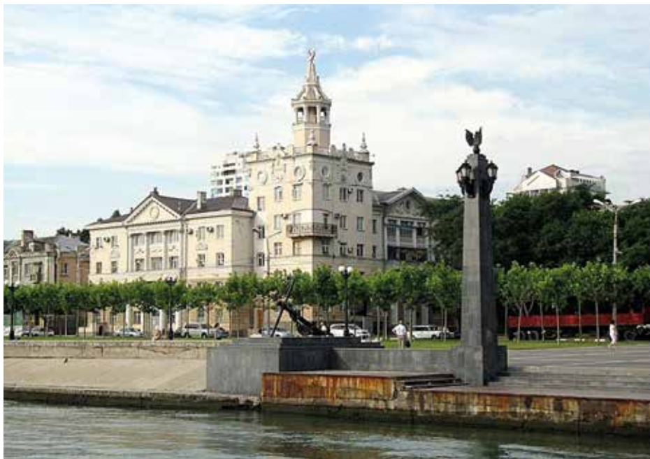
В. С. Данини, С. Чернобай. «Дом со шпилем» (1954 г.). 2009 г.