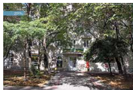
В. С. Данини, С. Чернобай. Жилой дом в Мичуринском переулке, 4, лит. А (1954 г.) Современное фото