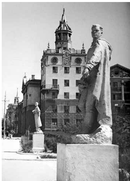
В. С. Данини, С. Чернобай. «Дом со шпилем» на углу Мичуринского переулка и улицы Мира, 23, лит. А (1954 г.). Фото 1959 г.

выделить удачные, годные для дальнейшего применения. Типовые разработки московских проектных мастерских не были рассчитаны на климат южных районов.