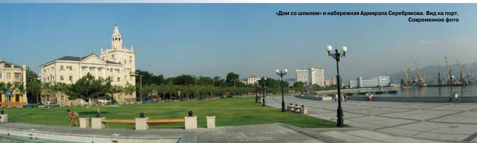
«Дом со шпилем» и набережная Адмирала Серебрякова. Вид на порт. Современное фото