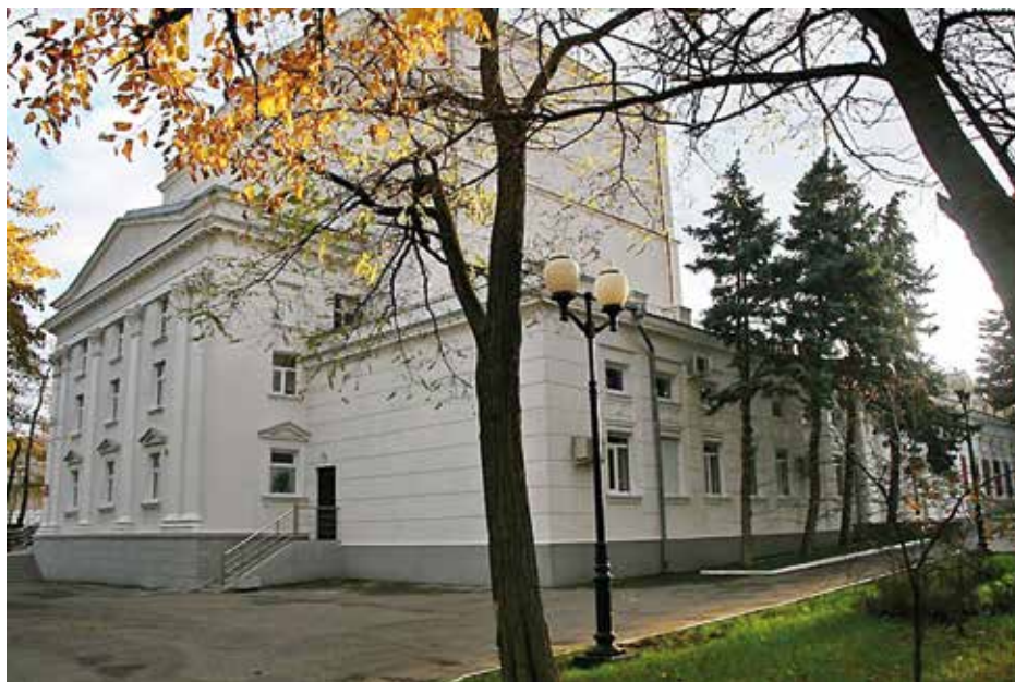
Новоросийский народный драматический театр. Современное фото